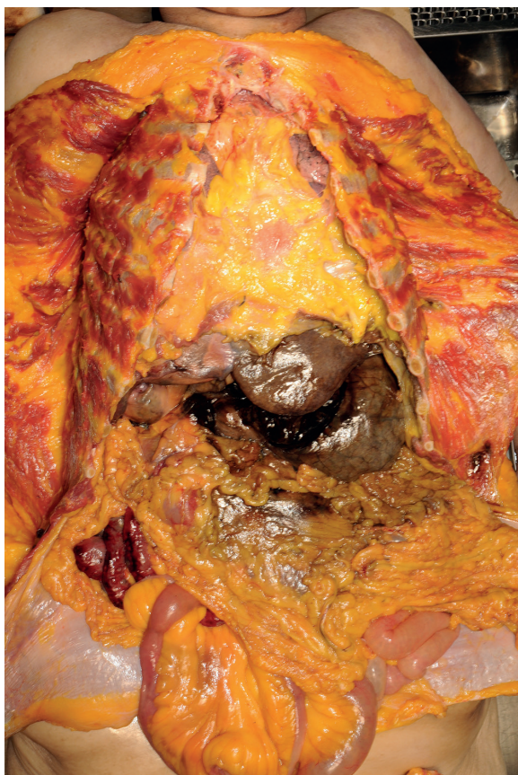
Figure 1. Discoloration of the stomach wall and surrounding tissues.

viously (4). In brief, the stomach contents were centrifuged (3000 rpm, 5 min), then the supernatant was analyzed. Bromophenol blue reagent (2 ml, 0.002% bromophenol blue in acetate buffer solution, pH 3.6) was added to 1 ml of sample and mixed gently. A dark green color provides a visual positive result, which indicates the existence of cationic surface activating agent in the sample by the reaction with bromophenol blue. Spectrophotometric analysis was performed using a Shimadzu UV-1700 (Kyoto, Japan).